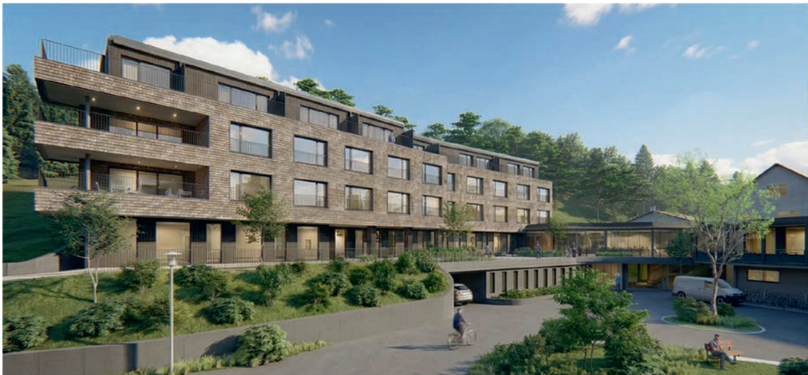
Grafik: MO Architektur GmbH

Die Stiftung St. Josef ist Rechtsträgerin der Pension Obersee, welche in Schmerikon das Alters- und Pflegeheim führt. Der nordwestliche Gebäudeflügel stammt noch aus den 50er Jahren und entspricht in verschiedener Hinsicht nicht mehr den heutigen Anforderungen. Der Stiftungsrat hat es sich deshalb zur Aufgabe gemacht, den zukünftigen Bedarf der Institution umfassend zu analysieren. Mit dem jetzt geplanten Neubau sollen moderne Pflegezimmer realisiert, derzeit fehlendes Raumangebot neu geschaffen und das Leistungsangebot den aktuellen und zukünftigen Bedürfnissen angepasst werden.